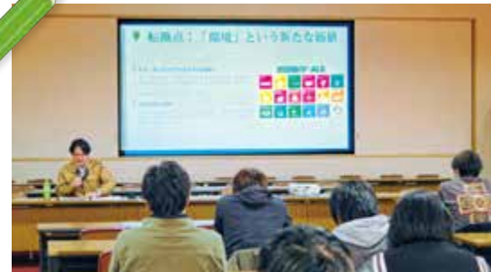
▲学習会の様子（Jークレジット）

参加者からは「Jークレジット制度を活用・普及する中で、バイ材炭、消費者理解、クレジットを活用した商品、需要などの中で一番足りないと思うのは何か」「補助事業の案内はどのようなルートで届くのか」などの質問や、「温室効果ガスの根本的な削減につながる省耕起などの普及推進をしてほしい」「利用しづらい事業が増えてい