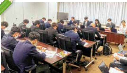
▲農林水産省 意見交換会

その後、農林水産省を訪れ、農産局園芸作物課の担当者8人と意見交換会を行いました。青年部からは肥料・農薬コスト上昇に対する国としての対応策や玉ねぎ栽培