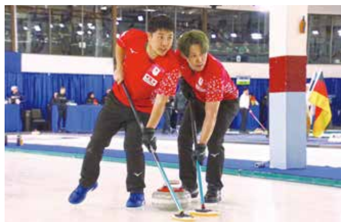
▲試合の様子（第3戦のポーランド戦）@青木貴紀