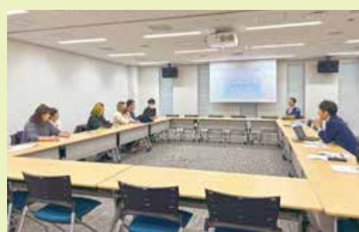
▲気象庁で意見交換をする様子

午後からは豊洲市場青果棟を視察し、きたみらい産の玉ねぎと馬鈴しよの品質について市場関係者とディスカッションを行いました。玉ねぎについては「気象の影響で令和7年産は思わしくなかったが、次年度に向けて気持ちを切り替えて頑張りたい」と励ましの言葉をいただきました。