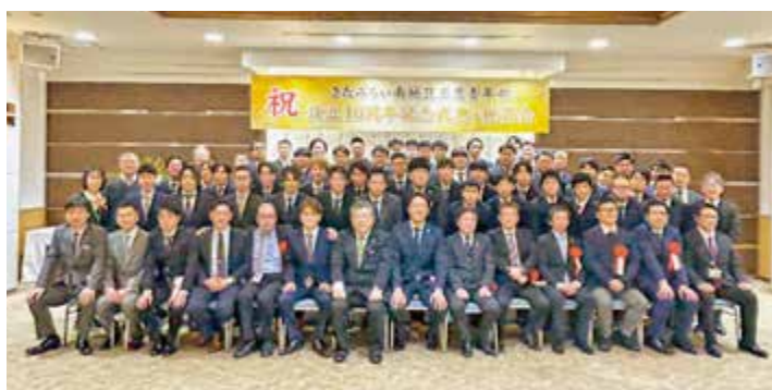
▲参加者全員での記念撮影