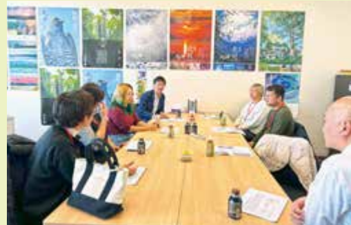
▲当JA東京事務所での意見交換