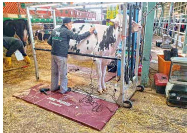
▲入念に牛を仕上げる出品者

収めました。未經産から経産まで幅広いクラスで入賞が続き、優等賞2席をはじめ複数頭が上位に名を連ね、改良水準の高さを示しました。生産者のためまめ努力と日頃の飼養管理の成果が発揮された大会となり、きたみらいの存在感を強く印象づける結果となりました。