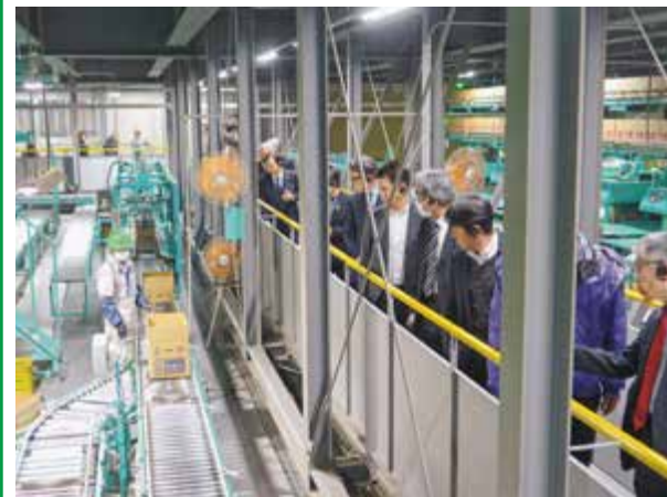
▲高知県高知市訪問団の選果場視察の様子

高知県高知市の訪問団26名が、1月14日に当JAの相内玉ねぎ集出荷施設を視察しました。副市長や市議会議員をはじめとする訪問団は、視察に先立ち玉ねぎ施設の概要や集出荷から流通までの体制について説明を受け、施設内を見学。選果や出荷作業の様子を熱心に視察しました。視察後には意見交換会を行い、産地づくりや安定供給、流通の取り組みについて理解を深めました。