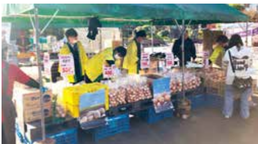
▲サイボクキッチンでの販促活動

維持を見据えた補助金のあり方など、農林水産省の担当者からは玉ねぎ栽培の輪作体系や有機質投入の状況などの質問が挙がりました。続いて、㈱大宮中央青果市場にご紹介頂いた、埼玉県日高市にある「サイボクキッチン」にて玉ねぎや赤玉ねぎ、馬鈴しょなどの他、当JA加工品の販促活動を行いました。玉ねぎの詰め放題では、用意した玉ねぎ約50CSが完売する盛況ぶりとなり、消費者と交流できる良い機会となりました。