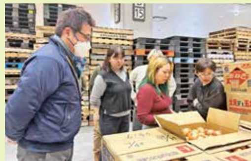
▲豊洲市場できたみらい産玉ねぎを確認する参加者