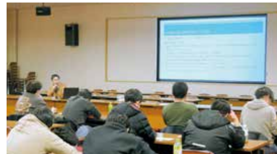
▲学習会の様子（補助事業）

えているように感じるため、機会があればJAからも関係機関への要請をお願いしたい」などの意見が多数挙がり、活発な学習、意見交換の場となりました。