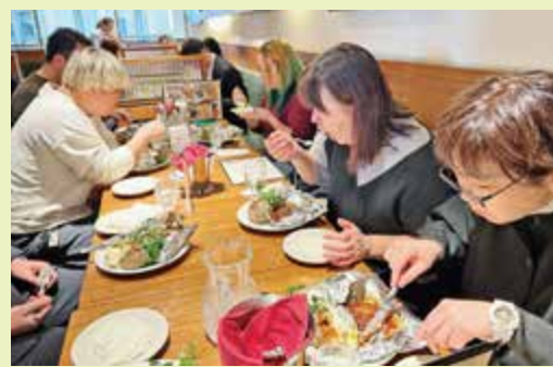
▲「つばめKITCHEN丸の内店」で昼食