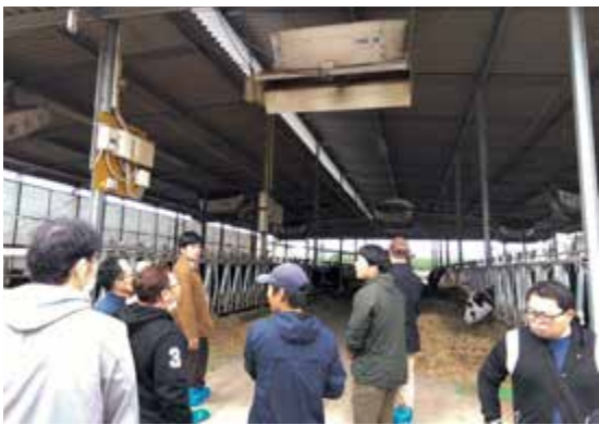
▲松島牧場の牛舎を見学する部員