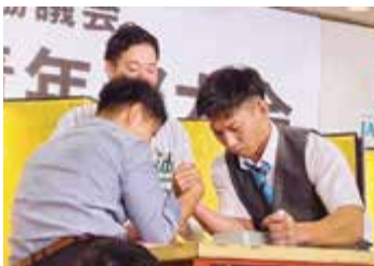
▲全道大会でアームレスリングを行う箱木部員（右）

後には地区役員3名とバブリー氏とのトークセッションが行われ、ギャルの視点から農業の課題について熱い討議が行われました。