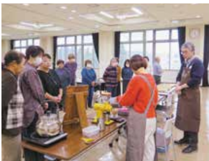
▲珈琲のおいしい淹れ方を学ぶ部員