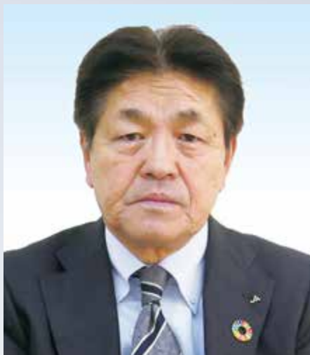
きたみらい農業協同組合