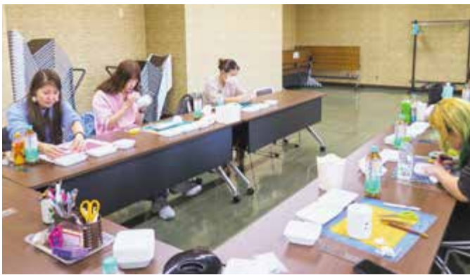
▲ポーセラーツの様子

野田農業振興センターでの「ラーメンの麺づくり」と、運動から物作りまで幅広い研修が行われました。