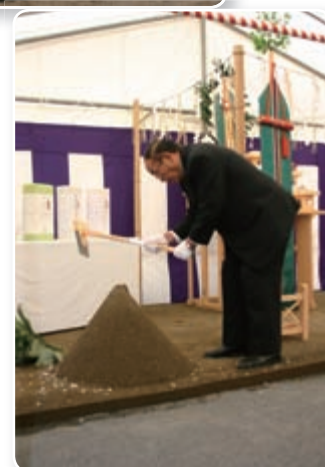
完成目指して安全祈願祭

平成19年2月の完成を目指して始まった小麦乾燥調製貯蔵施設新築工事。工事の安全を願って、安全祈願祭が執り行われた。【平成18年7月1日】