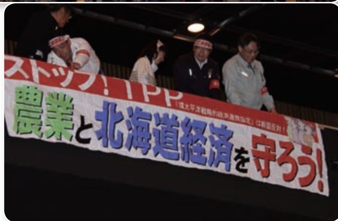
TPP交渉参加阻止北海道総決起大会

TPP交渉参加表明に反対する「道民集会」と「北海道総決起大会」が札幌市で開かれ、JAきたみらいからも役職員23人が参加。【4月27日】