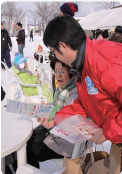
「TPPよく知って」と市民に啓蒙活動 第42回北見冬まつりイベント会場で、TPP交渉参加阻止に向けた啓蒙活動を行う。 【2月11日と12日】