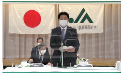
開会あいさつを述べる大坪組合長