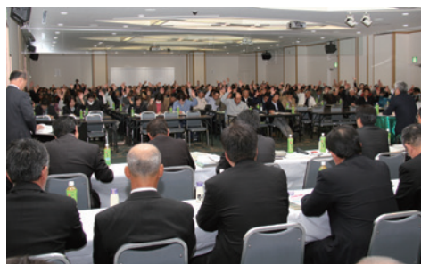
議案に挙手で賛成を表明する総代の皆さん