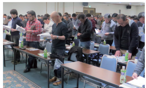
JA綱領を朗読する総代の皆さん