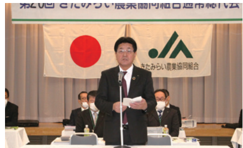
開会あいさつを述べる大坪組合長