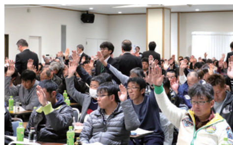
議案に挙手で賛成を表明する総代のみなさん