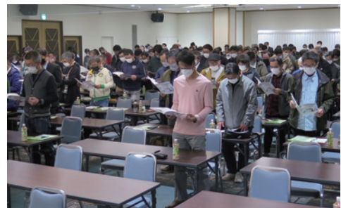
4年振りの通常開催となった総代会でJA綱領を朗唱する総代の皆さん