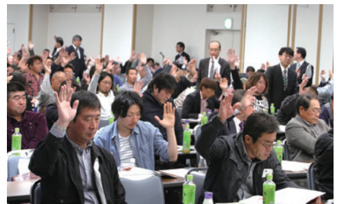
議案に挙手で賛成を表明する総代のみなさん