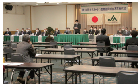
前年同様書面議決での開催となった総代会の様子