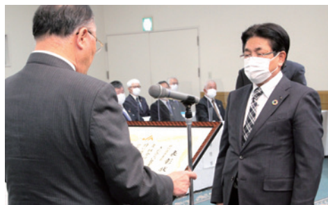
JA全中2021年度特別優良表彰を受賞した当JA(大坪組合長)