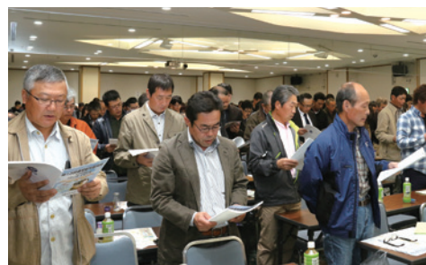
JA綱領を読み上げる総代の皆さん