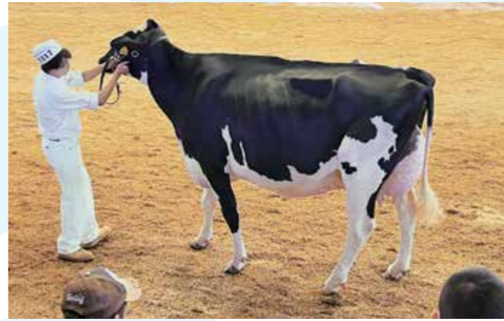
▲グランドチャンピオンの「ヨシノファーム ドア リンリン」

め、体型や資質などを競いました。共進会事務局の北海道ホルスタイン農協によると、比較可能な1996年以降で同一の出品者がザブグランドチャンピオンとリザーブグランドチャンピオンの2冠を達成するのは、