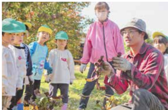
▲ビート・ビーツの説明を聞く園児たち

がら、大きい作物が採れると大喜びでミニコンに入れていきました。また、ヤーコンは特に大きく育ち、みんなで力いっぱい茎を引っ張って収穫しました。