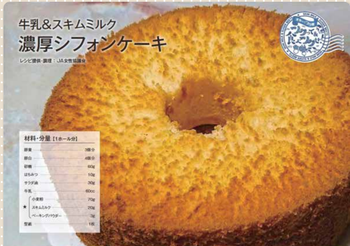
牛乳&スキムミルク 濃厚シフォンケーキ