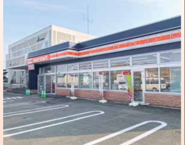
▲開店したセイコーマートの外観