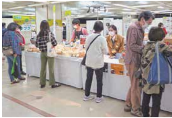
▲当JAと風楽里で出店したブースの様子

農業者と福祉事業所のマッチングを行う当JAは、協力事業所である「川東の里 風楽里」と合同で出店。玉ねぎや馬鈴しょの詰め放題、JA加工品の販売、同事業所で販売するパンや焼き菓子などを店頭に並べました。ブースでは、作業の様子を映した動画を流してPRに努めました。