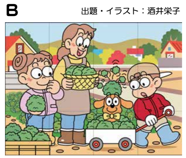
出題・イラスト：酒井栄子