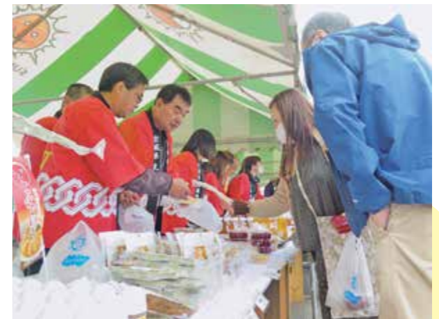
▲端野の姉妹都市・丸森町の物産も販売されました!

当JA端野地区事務所と北見市観光協会端野支部は10月21日に「端野物産フェア2023」を北見市端野総合支所前の特設会場で開催しました。「端野物産フェア」は「地元農産物収穫の喜びを消費者に届けたい!」という思いから毎年開催されています。新型コロナウイルス感染症拡大の影響により、令和2年から規模を縮小した中での開催でしたが、4年ぶりに規模を拡大しての開催となりました。前日の雨も上がり、好天の中、1,000人を超える多くの来場者で賑わいを見せました。当日はもち米予約券や青果物の特売のほか、来場者には数量限定で牛乳や紅白もちの無料配布が行われました。 1 ネット100円の詰め放題で用意した新玉ねぎと新じゃがいもはそれぞれ約7000〇〇〇〇、すつ用意され、開始前から長蛇の列ができ、参加した来場者は真剣な眼差しで詰め込んでいました。 また、北見市の姉妹都市である宮城県丸森町産の新米コシヒカリや梅干し等の特産品の販売、その他地産産馬鈴しょを使った(株)ロック・フィールドの「神戸コロッケ」の販売や常呂漁協のホタテなど海産物の販売も行われました。当日限定の特別価格での販売に来場者は笑顔を見せました。