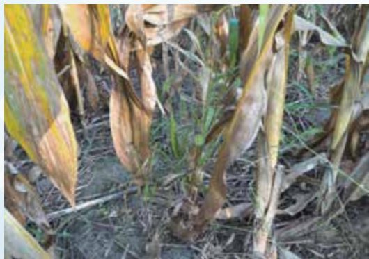
▲カバークロップの間に植えたトウモロコシ。撮影した9月の時点で、播種時にあった10~12cmのカバークロップのマットは分解されていた。生き残ったライ麦がみえる。