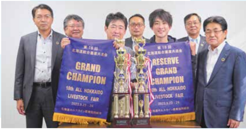
▲共進会後にJAへ受賞報告

くさん食べさせ、幅のある牛にしようとして心掛けてきた」と強調し、「地元のみなが自分以上に喜んでくれたのがうれしい」と話しました。酪農を取り巻く情勢が厳しい状況の中、「今後も毎年1等賞に入れるような牛をつくるのが目標。管理しやすく生産性のある牛を1頭でも多くつくり上げていきたい」と力を込めました。