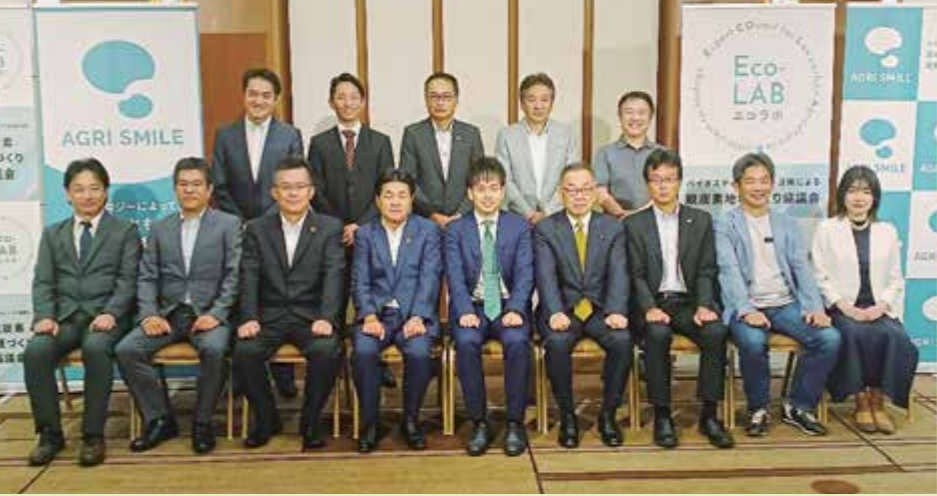
▲BSの取り組みを通じて脱炭素社会を目指す協議会(代表:株)AGRI-SMILE)立ち上げ時の記念写真

が高騰する中、BS実用化は農業経営の安定・所得向上につながる」と期待を寄せています。