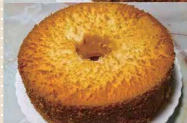
牛乳&スキムミルク 濃厚シフォンケーキ

JA女性協議会が考案した、スキムミルクを使ったレシピです。素材の持ち味を活かし、ケーキに仕上げました。オホーツクの農業が主眼、オキアキアキと一緒にお楽しみください。ぜひ皆さんも作ってみてください!