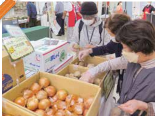
▲馬鈴しょの詰め放題を行う来場者

これまで札幌市や旭川市などで開催しており、北見市では初開催となりました。このイベントは障害者の職域拡大や工賃向上を図ることに、農業の担い手不足解消を目的に、取り組みを一般市民らに広く認知してもらおうと行われています。2日間で農福連携に取り組みオホーツク管内外の会社や団体など10か所が農産品や加工品を販売しました。