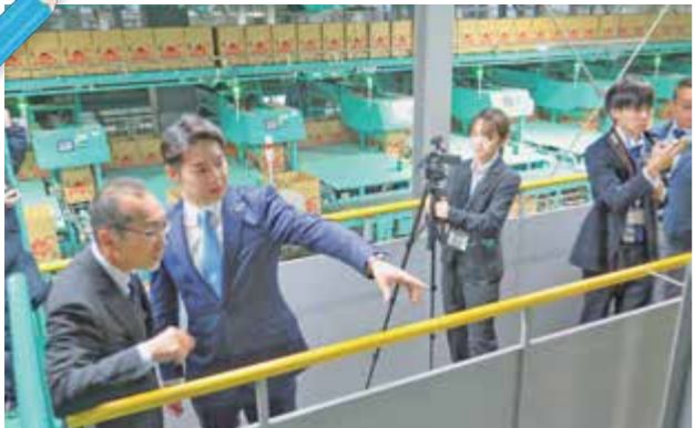
▲▼施設や玉ねぎを視察する鈴木知事