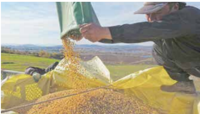
▲収穫した大豆をコンテナに移す様子