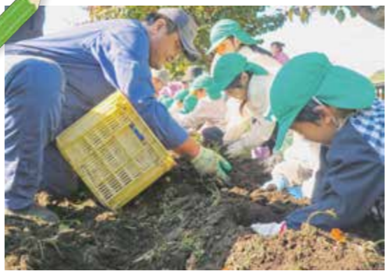
▲馬鈴しょを収穫する園児たち