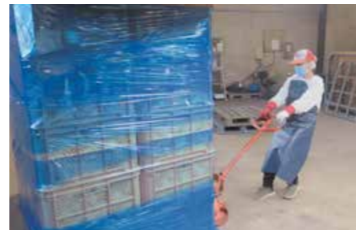
▲ケースに詰めたムキ玉を運ぶ実習生