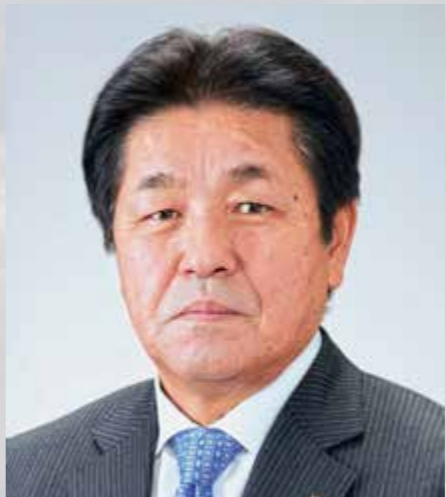
きたみらい農業協同組合