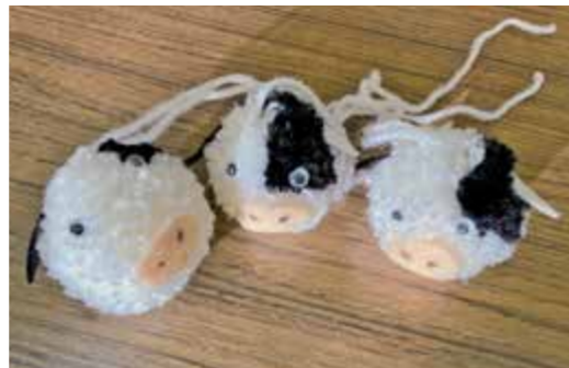
▲完成したマスコット