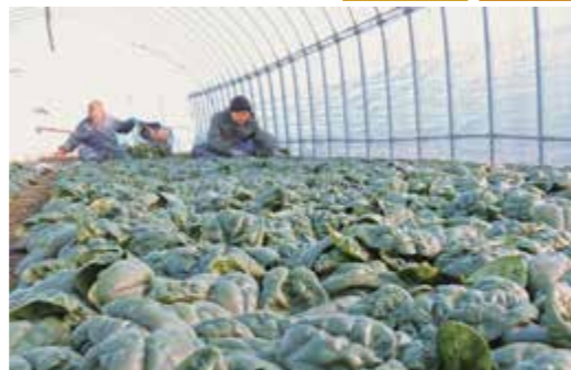
▲収穫作業をしている様子

当JAでは、6戸が約29畝を作付けしており、地元スーパーや道内各地へ出荷されます。