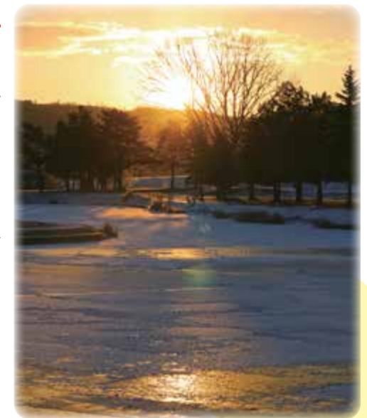
▲北見市常盤公園にて撮影(12/18) (撮影条件に恵まれず、来年再チャレンジ)

昨年は、なんと言っても新型コロナウイルスの年だったと思います。世界各地に広がった感染が生活を一変させ、新しいライフスタイルを余儀なくされた年でした。今年も、この感染症が終息を迎え、以前の日常が戻ることを切に願うとともに、今年一年災害なく豊穡の秋を迎えられますことを願っています。