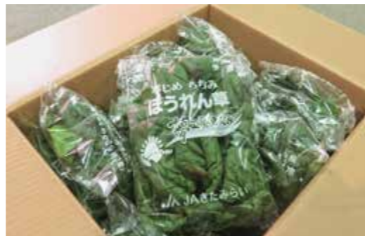
▲梱包されたちぢみほうれん草