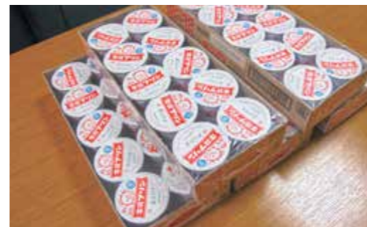
▲教育委員会へ贈呈した牛乳プリン