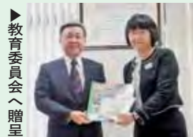
教育委員会へ贈呈

平成20年度から、食と農業への理解を深めるき っかけとなることを願い、JAを通じて食と農の つながりを解説した教材本とDVDを道内の小学 校へ贈呈しています。平成24年度からは特別支援 学校も対象とし、今年度は全道 1,086校に贈呈します。 本会から北海道教育委員会に 対し教材の贈呈を行い、教材活 用の協力を要請しております。