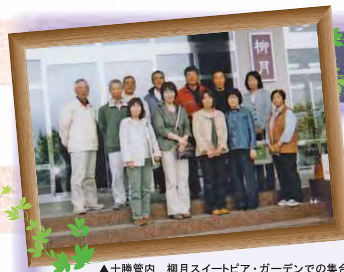
▲十勝管内 柳月スイートピア・ガーデンでの集合写真(上段の左から1番目が可知さんです)