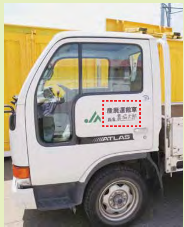
▲産業廃棄物運搬車の表示が義務化されております