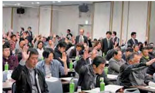
▲議案に挙手で賛成を表明する総代のみなさん