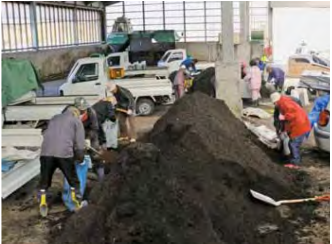
▲堆肥を袋詰めする町民のみなさん