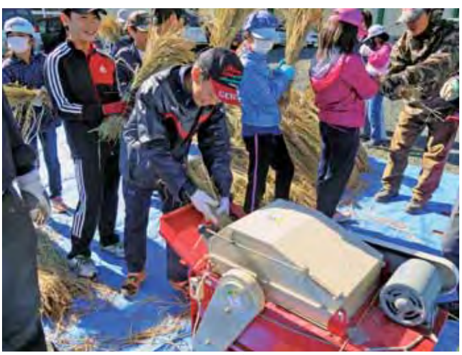
▲脱穀作業を行う相内小の児童たち

12月には精米したもち米を使用した餅つきを行い、全校児童に振る舞われる予定です。(梅澤 大)