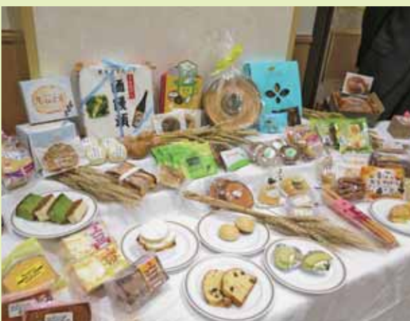
▲参加事業者が開発したオホーツク産原料使用のお菓子

今後、振興局にてポスターや菓子店マップ、POPなどを作成し、魅力発信に力をいれていくということです。