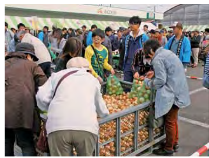
▲笑顔で玉ねぎを詰め込む来場者のみなさん