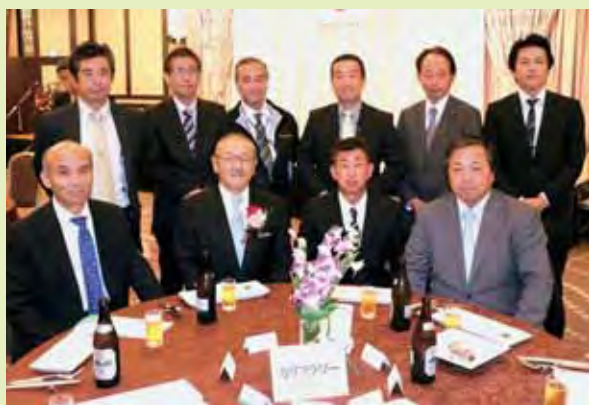
▲感謝状が授与された産地と主催者側との記念写真