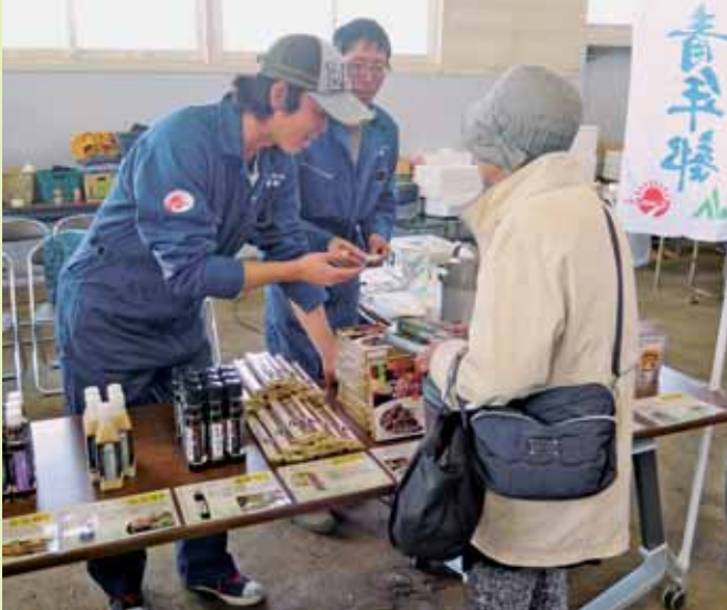
▲きたみらいオリジナル商品を販売する青年部役員

JAきたみらい青年部は役員7人が参加し、JAきたみらいオリジナル商品を販売しました。今回販売した商品（玉ねぎと牛すじのカレー、玉ねぎと鶏もも肉の黒カレー、麦まるごとうどん、各種トレッシング、芳醇玉葱醤油、北見玉葱焼肉のたれ、オニオンコンソメ、白花美人）のほとんどが売れ切れとなり、大好評となりました。