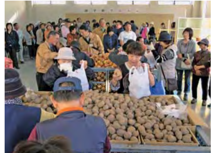
▲行列ができた玉ねぎと馬鈴しょの無料袋詰め放題

10月17日、訓子府町で町商工会主催の「第3回ストリートフェスタ」が行われました。