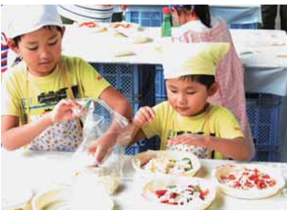
▲ピザ作りを体験する子どもたち