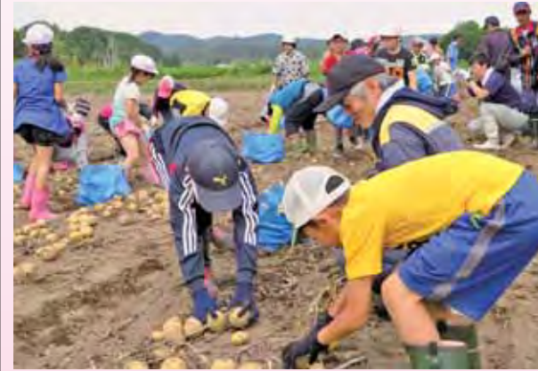
▲てきばきと収穫を行う端野小のみんな

北見市農業振興会議端野自治区部会は8月26日、地産地消振興事業の一環として端野小学校4年生を対象としたジャガイモの収穫体験を行い、40人の児童が参加しました。 馬鈴薯振興会平川会長の圃場で「とうや」の収穫を行い、児童たちはてきばきと元気良く、芋を拾い上げていきました。休憩後からは「レッドムーン」「ローザンルビー」「シャドークイーン」の収穫もさせてもらうことに。土の中から赤色、紫色の芋が出てくるたびに、児童から歓声が上がりました。 児童たちは収穫した芋を、嬉しそうに持ち帰っていきました。