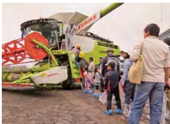
▲コンバインの乗車体験をする参加者のみなさん

た小麦を主原料とし、北海道産の全粒粉を加えて作った「麦香」麦まるごと」の試食も行われました。