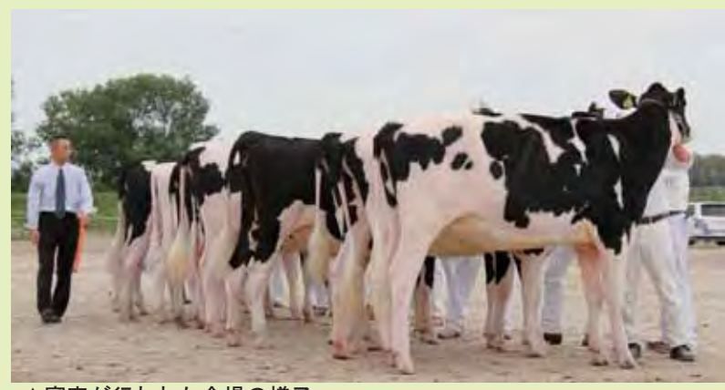
▲審査が行われた会場の様子