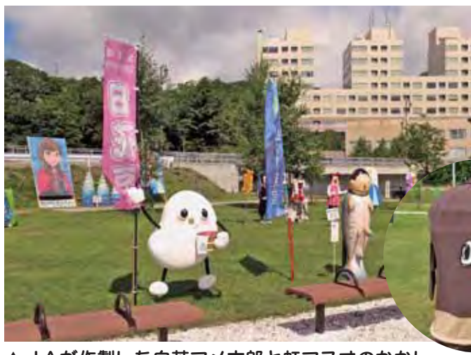
▲JAが作製した白花マメ太郎と虹マスオのかかし丸写真は青年部が作製したねばー君