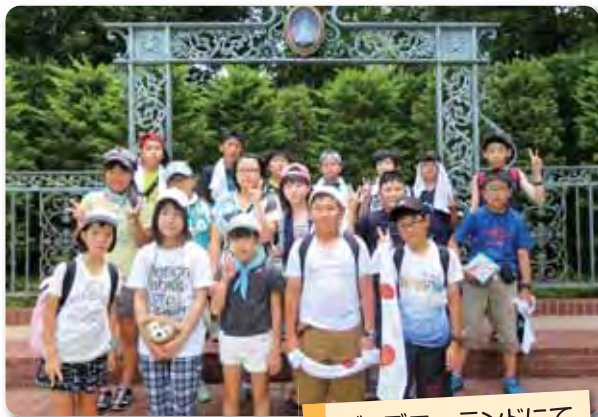
ディズニーランドにて

2日目はみんなが楽しみにしていたディズニーランドへ。初めての人も多かったなか、前日夜にホテルで計画を立て、班ごとに回ってもらいました。夏休みということもあり、場内は少々混雑気味で、思ったように乗り物に乗れなかった班もありましたが、それもまた良い経験になったのではないのでしょうか。朝から夜まで1日中遊び、夜はぐっすりの眠りました。