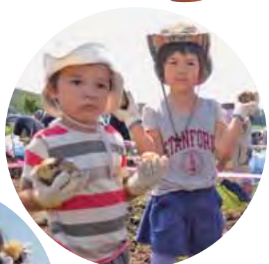
▲芋を手にとって、はいっポーズ!