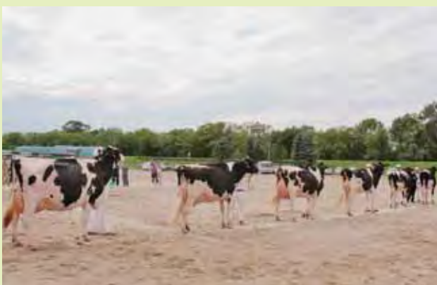
▲グランドチャンピオン決定戦に臨む!