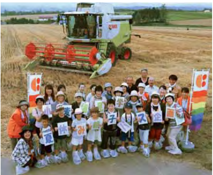
▲小麦畑の前で記念撮影する参加者のみなさん

ツアーでは、はじめに訓子府町北栄の小麦圃場で大型コンバインによる収穫作業見学、同機の試乗体験が行われ、生産者がきたみらい地域の小麦について説明。参加者か