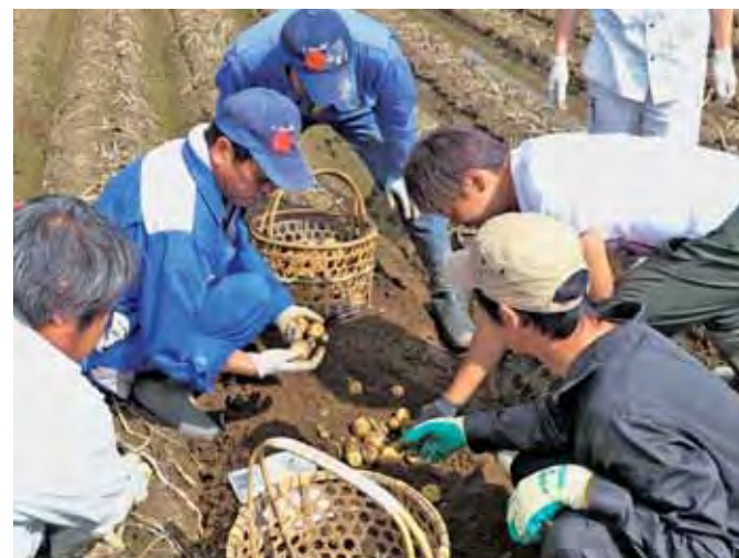
▲掘り出した種芋の大きさを確認する生産者のみなさん