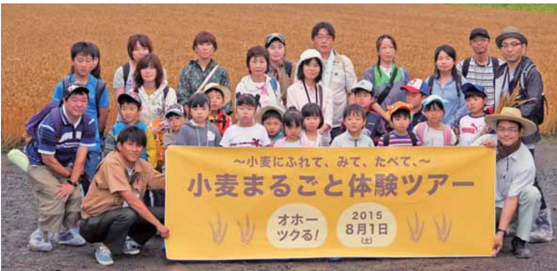
▲夏休みの思い出に、小麦畑を背にしてみんなで集合写真

その後、北見市西相内のJA小麦乾燥調製貯蔵施設に移動し、刈り取られた小麦がトラックから施設内に受入される様子を見学。土屋職員から施設についての説明を受けた子どもたちは、感心した様子で熱心に耳を傾けていました。