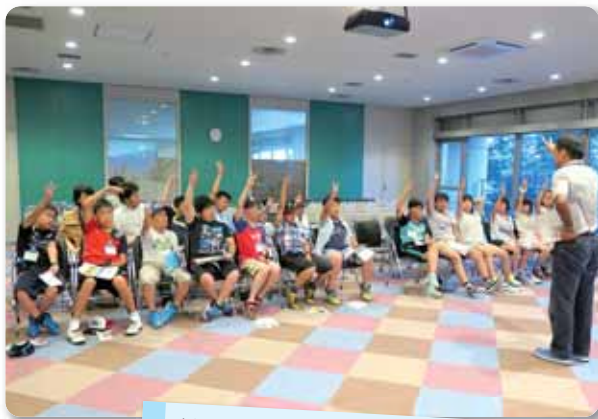
せりで使われている数え方を練習

最終日は早起きをして東京都の大田市場を訪問。まず会議室にて市場の役割と流通の仕組みをビデオで学び、せりで使われている指で数字を示す方法を教えてもらいました。 その後、東洋一広いと言われる場内を見学。全国の産地から運ばれてきたダンボールがずらりと並んでおり、初めて見る光景にみんな興味津々な様子でした。実際にせりが行われる場所にも入らせていただき、「こ