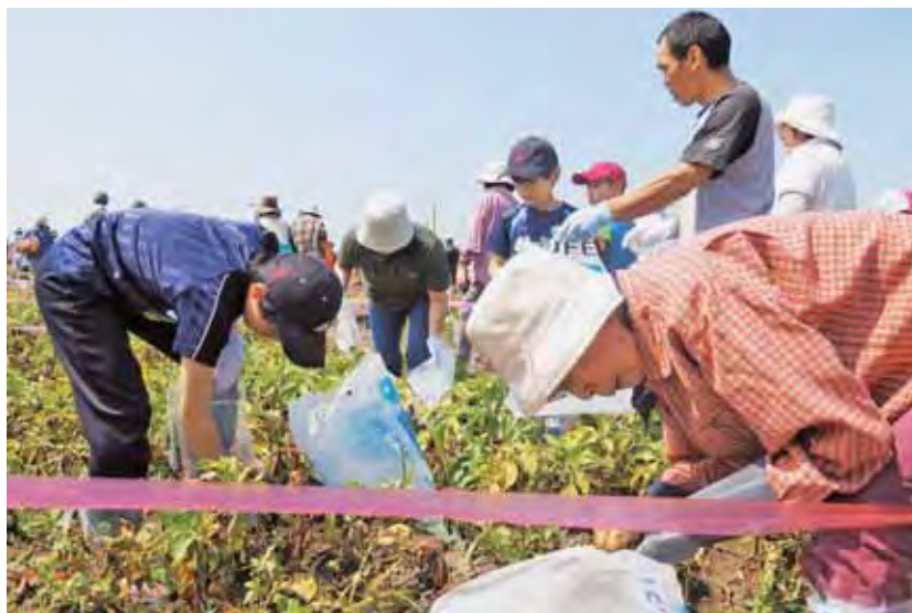
▲芋が出てくるたびに歓声上がる会場

今年で28回目を迎える農業体験「がぶりがるちゃー」が8月8日、北見市仁頃の田園空間情報センターの圃場で行われ、「家族芋掘り体験会」に親子149組、総勢538人が参加し、大いに賑わいました。同事業は北見市、JAきたみらい、土地改良区のほか7団体で構成する「がぶりがるちゃー実行委員会」が主催。農業体験を通して消費者に地域農業への理解を深めてもらい、農村と都市との交流を通じて、ふるさとの活性化を図ることを目的としています。