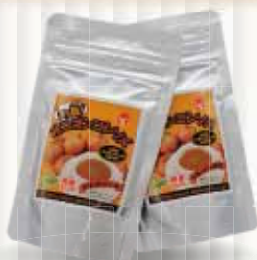
▲オニオンコンソメ