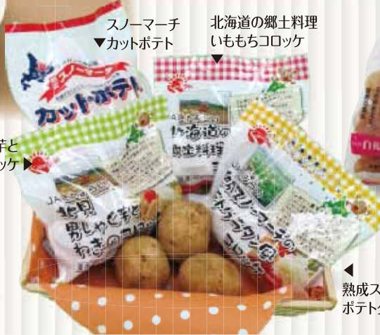
スノーマーチ ▼カットポテト