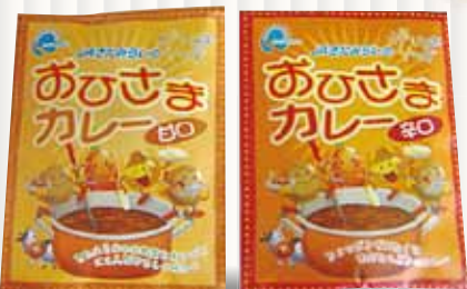
▲JAきたみらい おひさまカレー