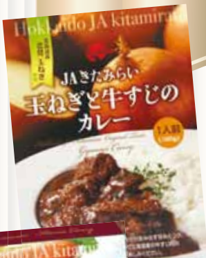
▶玉ねぎと牛すじのカレー

JAきたみらい地区で収穫された農産物の美味しさや安全安心、生産者の思いを全国の消費者に直接伝えるためにオリジナル加工商品をお届けしております。