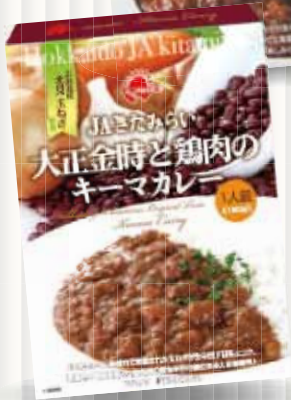
◀大正金時と鶏肉のキーマカレー