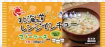
▲北海道レンジでシチュー